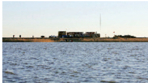
Аудандағы Әйке көлі

ӘЙТЕКЕ БИ АУДАНЫ – Ақтөбе обл.-ның солт.-шығыс бөлігіндегі әкімш. бөлініс. Жер аум. 36,3 мың км 2 . Тұрғыны 31,3 мың адам, орташа тығызд. 1 км 2 -ге 0,8 адамнан келеді (2010). Аудан орт. – Комсомол а. Аудан 1996 жылға дейін Қарабұтақ ауд. аталды. Ауданда 50-дей елді мекен бар. Олардың ірілері: Аралтоғай, Аралтөбе, Бөгетсай, Қарабұтақ, Жабасак, Құмқұдық а.-дары. Аудан жері негізінен үстіртті жазық (биікт. 100 – 400 м) келеді. Солт.-шығысын Мұғалжар тауы алып жатыр. Климаты тым континенттік, қысы суық, жазы ыстық. Қаңтардың орташа темп.-расы –17°С, шілдеде 22°С. Жауын-шашынның жылдық мөлш. 200 – 250 мм. Аудан жерінен солт.-тен оңт.-ке қарай Ырғыз өз. және оның Қарабұтақ, Қайрақты, Шолаққайрақты, Ұлыталдық, Балаталдық, т.б. салалары ағып өтеді. Аудан аумағында Белқопа, Әйке, Тегіссор көлдері бар. Аудан жері негізінен қоңыр, қызғылт қоңыр топырақты келеді. Өсімдіктерден боз, бетеге, жусан, қамыс, киікоты, жоңышқа, изен, тобылғы, көкпек, қараған, алабота өседі. Жануарлардан түлкі, қарсақ, қоян, қасқыр, күзен, борсық, ақ бекен, киік; құстардан қаз, үйрек, тырна, дуадақ, жылқышы,